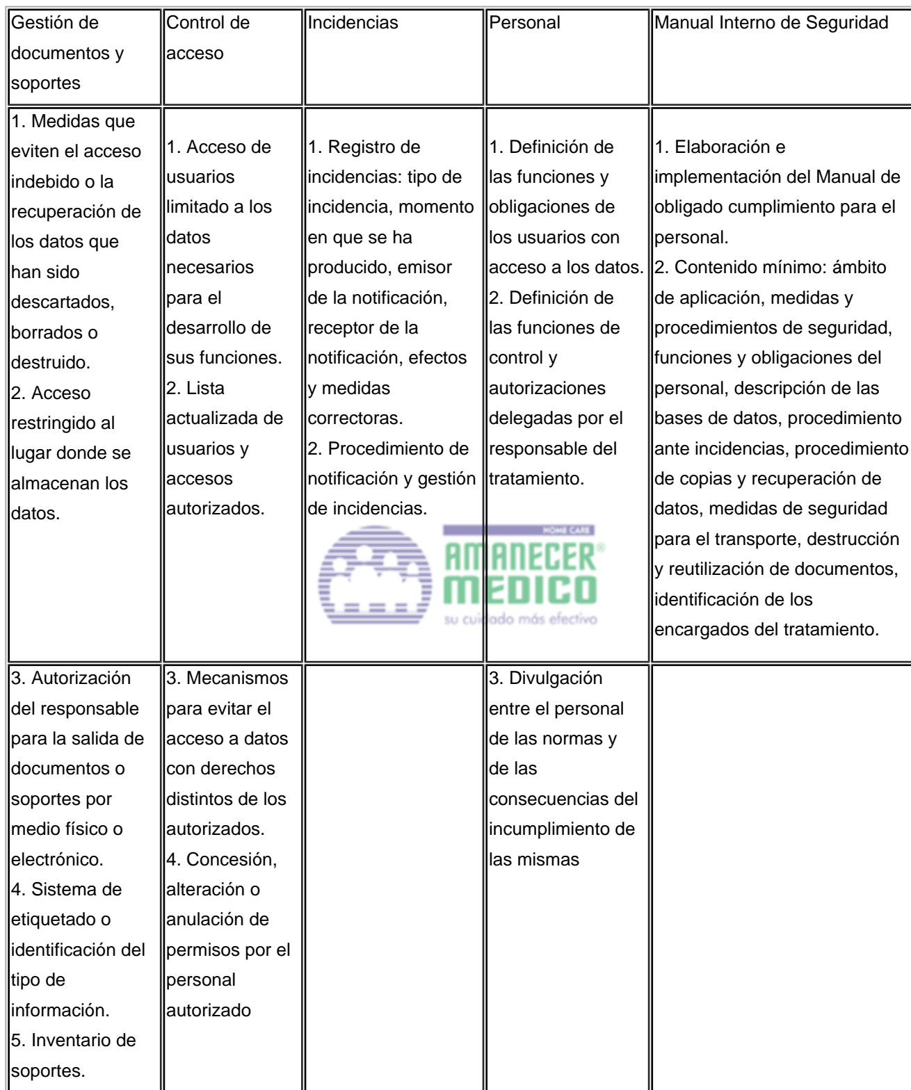
TABLA I: Medidas de seguridad comunes para todo tipo de datos (públicos, semiprivados, privados, sensibles) y bases de datos (automatizadas, no automatizadas)